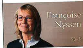
☛ Plaisir et nécessité , de Françoise Nyssen, Éditions Stock, 336 p., 20,50 €.